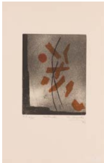
209 Michiyoshi Deguchi (1955) Base d'asta € 100 Meteorites - 1973 Acquatinta su carta, es. E.A. 12/15 cm. 50x33 Certificato di originalità con foto a cura del Prof. Giuliano Agostinetti Firma in basso a destra