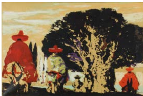
216 Salvatore Fiume (1915-1997) Base d'asta € 200 Messicani - Serigrafia su tela, es. prova d'artista cm. 42x62 Certificato di autenticità a cura del Centro Artistico Milanese, Milano Firma in basso a destra