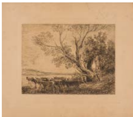
190 Charles Francois Daubigny (1817-1878) Base d'asta € 100 Le Gué - 1865 Acquaforte e puntasecca cm. 43x50 Esemplare edito dalla stamperia del Louvre, con Timbro a secco delle Editions du Louvre. L'opera presenta alcune tracce di foxing