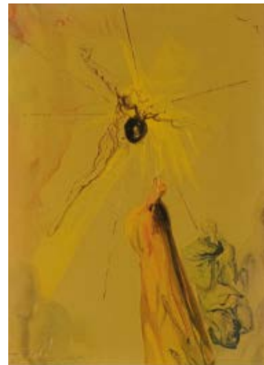
210 Salvador Dalí (1904-1989) Base d'asta € 200 Apparizione - Stampa su lamina d'argento 800, es. 272/999 cm. 25x19 Certificato di garanzia a cura di Le Connaisseur du livre, Milano sul retro. Etichetta della Bevilacqua Arte, Padova, sul retro Firma in basso a sinistra