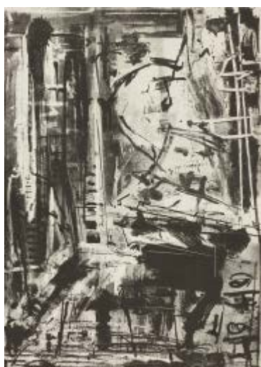
224 Emilio Vedova (1919-2006) Base d'asta € 200 Senza titolo - 1977 Litografia su carta, es. 79/99 cm. 70x50 Firma in basso al centro