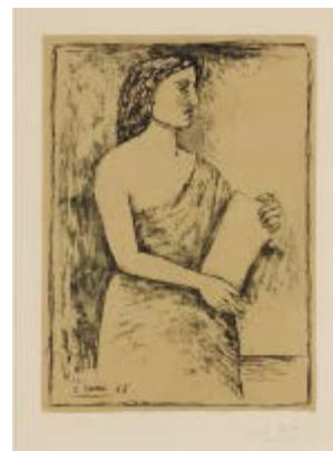
187 Carlo Carrà (1881-1966) Base d'asta € 250 Donna con il libro - 1962 Litografia su carta, es. 20/100 cm. 65x50 Firma in basso a destra