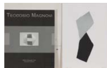
227 Teodosio Magnoni (1934) Base d'asta € 100 Senza titolo - 2001 Catalogo d'arte con grafica cm. 22x19 Grafica firmata in basso a sinistra Grafica: collage su cartoncino, es. 53/100, cm. 25x17, 2002