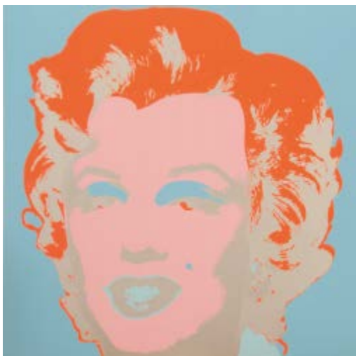
219 Andy Warhol after Base d'asta € 200 Marilyn - Serigrafia su carta, open edition cm. 91,4x91,4 Edizioni Sunday Be Morning