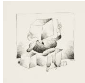
199 Tullio Pericoli (1936)

Base d'asta € 150 Senza titolo - Incisione, es. 31/100 cm. 15x16 inciso - cm. 50x35 Firma in basso a destra dell'inciso