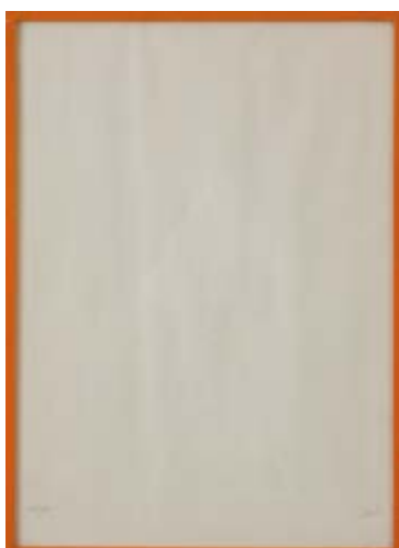
202 Mario Ceroli (1938)

Base d'asta € 100 Senza titolo - Serigrafia su carta cm. 35x15