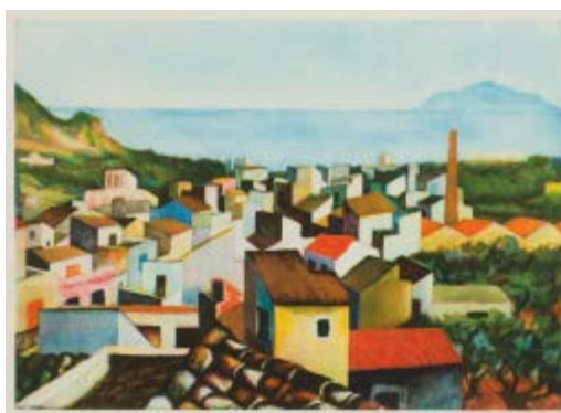
217 Renato Guttuso (1911-1987) Base d'asta € 150 Senza titolo Acquaforte e acquatinta su carta, es. 105/120 cm. 45x62 Firma in basso a destra