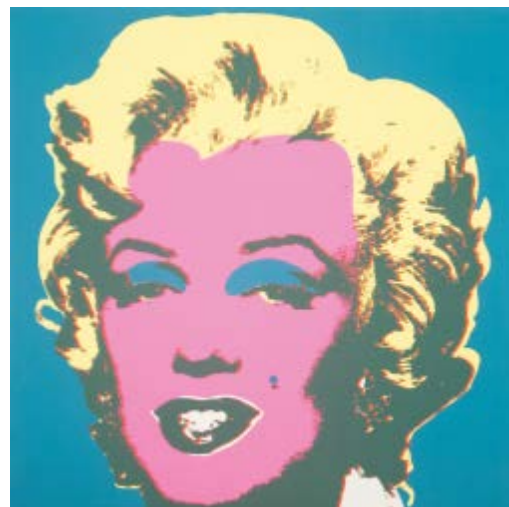
220 Andy Warhol after Base d'asta € 200 Marilyn - Serigrafia su carta, open edition cm. 91,4x91,4 Edizioni Sunday Be Morning