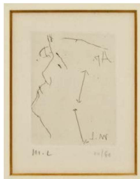
206 Michel Larionoff (1881-1964)

Base d'asta € 100 Senza titolo - Acquatinta su carta Japan cm. 50x33 Firma in basso a destra