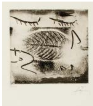
198 Antoni Tàpies (1923-2012)

Base d'asta € 150 Senza titolo - acquaforte, es. PL. XIII 79/100 cm. 16x23 inciso - cm. 37x49 Firma in basso a destra dell'inciso