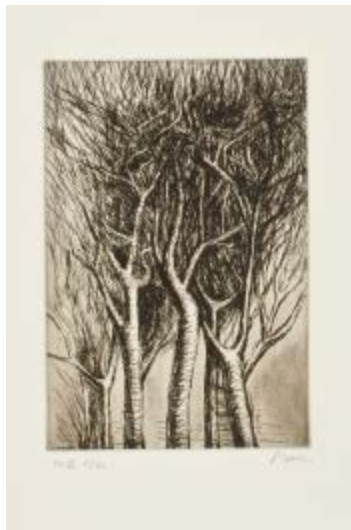
207 Henry Moore (1898-1986) Base d'asta € 150 Senza titolo - Acquaforte su carta, es. PV II 27/50 cm. 23x16 lastra - cm. 53x44 Firma in basso a destra dell'inciso