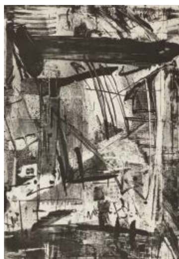
226 Emilio Vedova (1919-2006) Base d'asta € 200 Senza titolo - 1977 Litografia su carta, es. 44/99 cm. 70x50 Firma in basso a destra