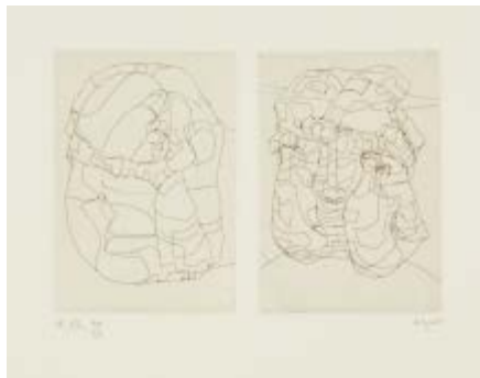
197 Henry Moore (1898-1986)

Base d'asta € 100 Senza titolo - 1957 Linoleumgrafia su carta riso, es. 22/60 cm. 13x16 Firma in basso a sinistra