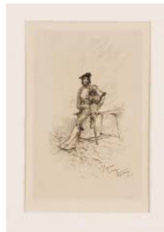
195 Mariano Fortuny (1838-1874) Base d'asta € 100 Torero - Fotoincisione cm. 25x17 Firma in basso a destra