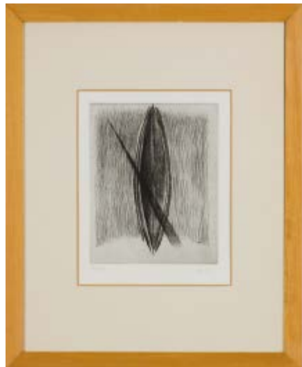
208 Nunzio (1954) Base d'asta € 200 Senza titolo - Acquaforte e puntasecca, es. XXIX/L cm. 30x24 Misura foglio cm. 50x40 Firma in basso a destra