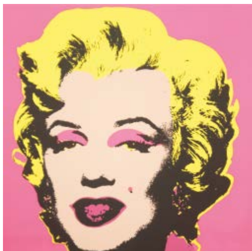
221 Andy Warhol after Base d'asta € 200 Marilyn - Serigrafia su carta, open edition cm. 91,4x91,4 Edizioni Sunday Be Morning