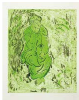
213 Sandro Chia (1946) Base d'asta € 100 Senza titolo 1981 Acquaforte e acquatinta a colori, es. 47/50 cm. 59x48 lastra, cm. 80x60 foglio Firma e data in basso a destra