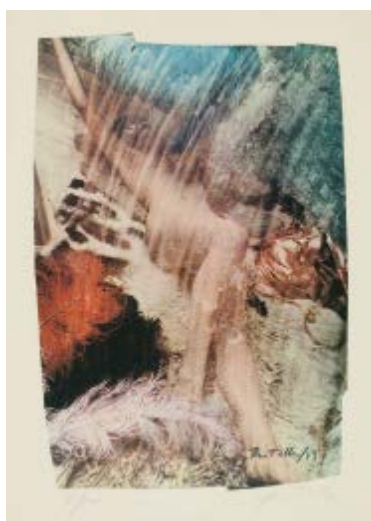
225 Mimmo Rotella (1918-2006) Base d'asta € 100 Senza titolo - Multiplo, stampa offset es. 35/100 cm. 48x69 Firma in basso a destra