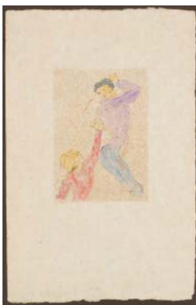
205 Léonor Fini (1907-1996)