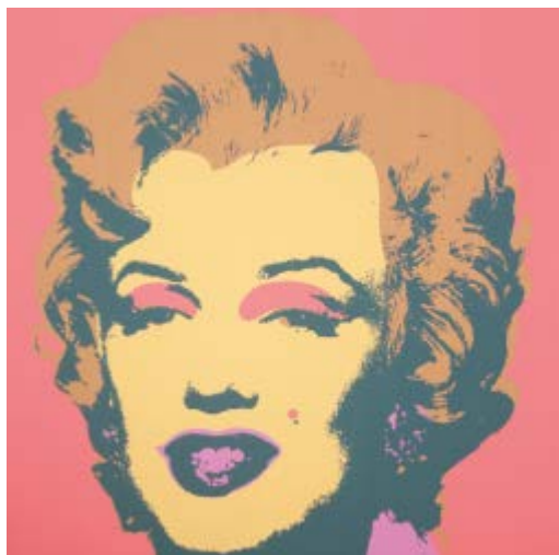
218 Andy Warhol after Base d'asta € 200 Marilyn - Serigrafia su carta, open edition cm. 91,4x91,4 Edizioni Sunday Be Morning