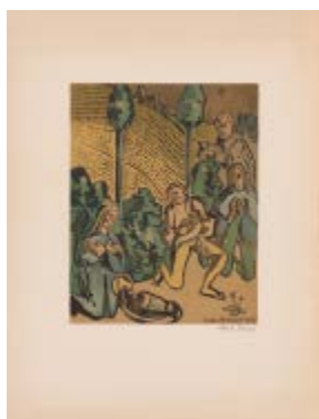
189 Emile Bernard (1868-1941) Base d'asta € 100 L'adoration des bergers Fotolitografia da xilografia cm. 50x38 L'opera presenta una gora d'acqua in basso a destra e una in alto a destra Firma stampata in basso a destra