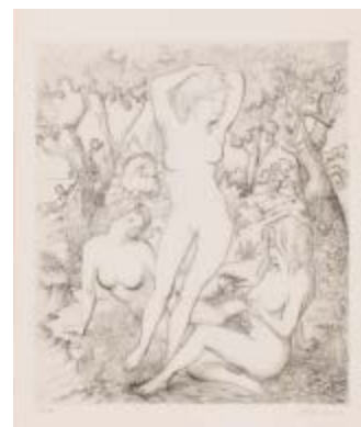
191 Aliqi Sassu (1912-2000) Base d'asta € 100 Le grazie - Acquaforte su carta, es. 45/100 cm. 41x34 Certificato di autenticità a cura di Centro Annunciata SO.GE.CA Firma in basso a destra