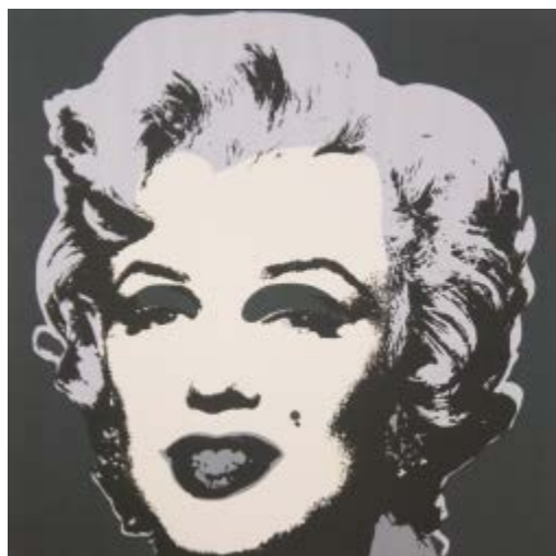
223 Andy Warhol after Base d'asta € 200 Marilyn - Serigrafia su carta, open edition cm. 91,4x91,4 Edizioni Sunday Be Morning. L'opera presenta alcune pieghe lungo i bordi.