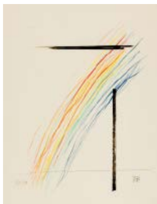
211 Man Ray (1890-1976) Base d'asta € 150 Senza titolo Litografia a colori, es. 57/100 cm. 39x29 Firma in basso a destra